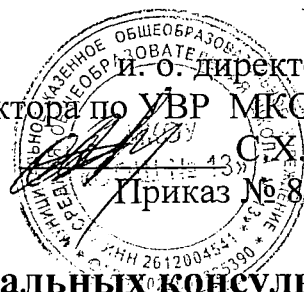
График проведения индивидуальных консультаций со слабоуспевающими и неуспевающими обучающимися